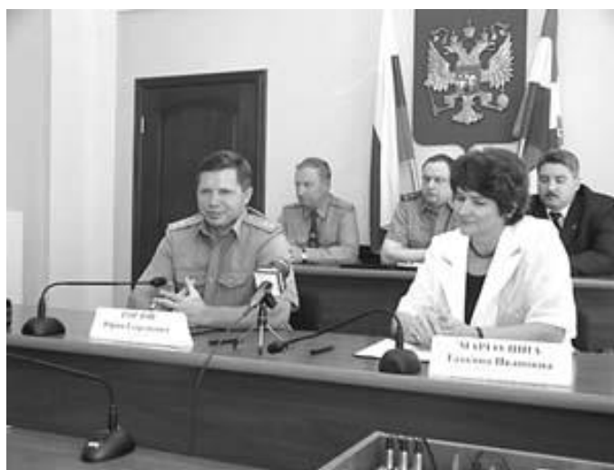
Подписание соглашения о сотрудничестве между ГУВД Пермской области и Уполномоченным по правам человека в Пермской области.

Несмотря на определенные перспективы решения материально-бытовых проблем, в ряде ИВС (Добрянском, Краснокамском, Нытвенском) необходимы меры экстренного реагирования на вопиющие условия нахождения людей. Так, например, в ИВС ОВД г. Добрянки арестованные вынуждены для умывания и питья пользоваться водой из трубы, предназначенной для смыва фекалий и расположенной в 30 см от канализационного отверстия, отправлять естественные надобности на глазах у всех остальных, содержащихся в камере, поскольку полностью отсутствуют какие-либо ограждения. Для оправления задержанных в ИВС Чердыни используются ведра, простаивающие наполненными длительное время в камерах и создающие смрад.