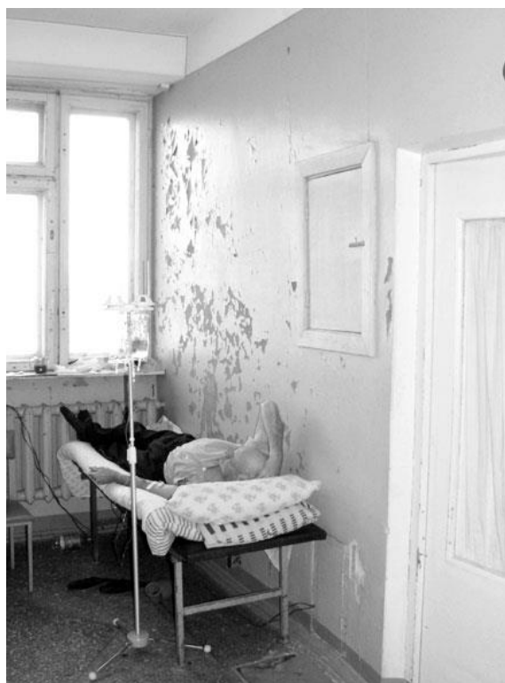
Состояние неврологического отделения МСЧ № 3

В учреждениях появилась информация для населения о видах медицинской помощи, гарантированной государством.