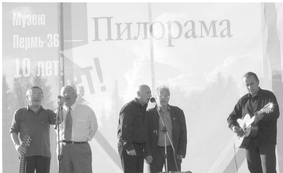
Фестиваль гражданской песни в Мемориальном музее-центре «Пермь-36» Август 2005