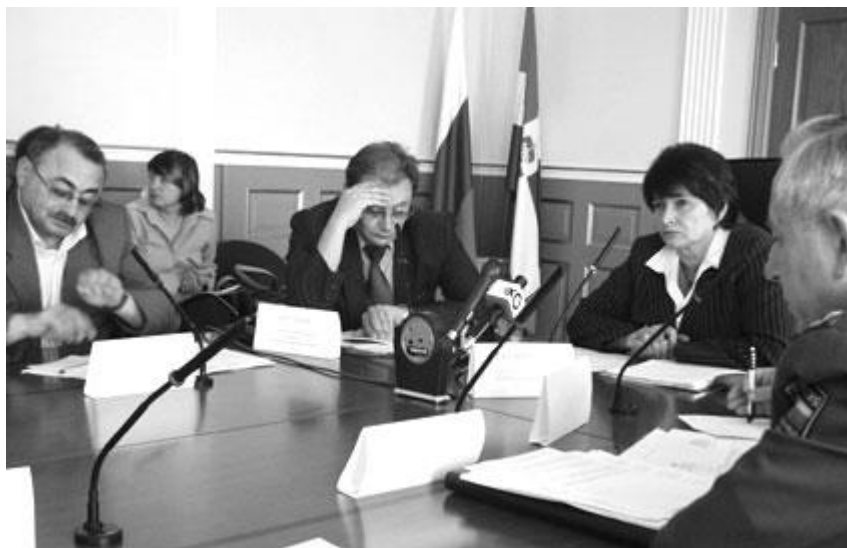
Круглый стол “Проблемы защиты прав военнослужащих и призывников” Август 2005 год

Присвоение военными комиссариатами полномочий призывных комиссий. Одной из основных проблем в сфере призыва на военную службу является присвоение военными комиссариатами полномочий, возложенных законом на призывные комиссии, которые являются гражданскими структурами. Военные комиссариаты незаконно возлагают на себя несвойственные им по закону функции и полномочия, которые входят в компетенцию призывных комиссий, что, в конечном счёте, ведет к нарушению прав граждан.