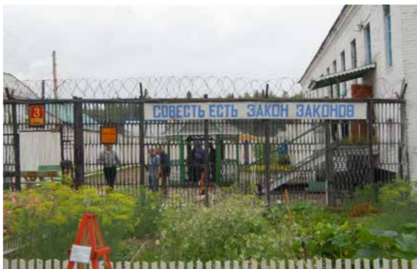
ФКУ ИК-35 ГУФСИН России по Пермскому краю