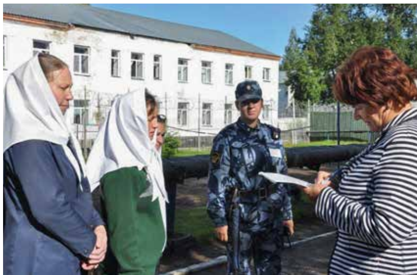
ИК-18 ФСИН России по Пермскому краю