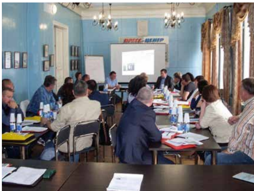
Семинар с начальниками медсанчастей ФКУЗ МСЧ № 59 ФСИН России - колонии